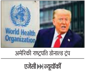
अमेरिकी राष्ट्रपति डोनाल्ड ट्रंप

एजेसी ► न्यूयॉर्क अमेरिका ने विश्व स्वास्थ्य संगठन (डब्ल्यूएचओ) से हटने की प्रक्रिया पूरी कर ली है। संघीय अधिकारियों ने गुरुवार को यह जानकारी दी। यह घटनाक्रम अमेरिकी राष्ट्रपति डोनाल्ड ट्रंप के वैश्विक स्वास्थ्य निष्काय के प्रति वाशिंगटन की 78 साल पुरी प्रतिबद्धता खत्म किए जाने को नोटिस देने के लगभग एक साल बाद सामने आया है।