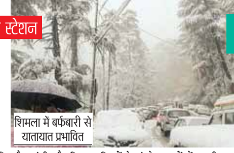
शिमला में बर्फबारी से शालायत प्रभावित

हिमाचल प्रदेश की राजधानी शिमला और मनाली में शुक्रवार को मौसम की पहली बर्फबारी हुई। इससे सड़कें और पहाड़ पूरी तरह से सफेद हो गए। बर्फ से ढके नजारों का मजा लेने के लिए बड़ी संख्या में पर्यटक भी पहुंचे हैं। लाहौल-स्पीति, चंबा, कुल्लू, किन्नौर, सिरमौर, मंडी और शिमला जिलों के ऊंचे इलाकों में हल्की बर्फबारी हो रही है। शिमला के पास कुफरी और नारकंडा जैसी जगहों पर भी बर्फबारी हो रही है। कांगड़ा घाटी की शानदार धोलाधार पर्वत श्रृंखलाओं पर बर्फ की ताजी चादर बिछ गई है। शिमला से 10 किमी दूर ढल्लो से आगे ट्रैफिक रोक दिया गया, क्योंकि भारत-तिब्बत रोड का एक बड़ा हिस्सा बर्फ की मोटी चादर से ढका हुआ था। भारी बर्फबारी के कारण पूरा किन्नौर जिला और शिमला जिले के नारकंडा, जुब्बल, कोटखाई, कुमारसैन, खड़ापत्थर, रोहडू और चौपाल जैसे शहर कट गए हैं।