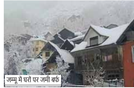
जम्मू में घरों पर जमी बर्फ

◀ श्रीनगर में फ्लाइट ऑपरेशंस बुरी तरह प्रभावित ◀ भारत-तिब्बत रोड का एक बड़ा हिस्सा बाधित