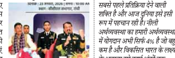
भारतीय नौसेना हिंद महासागर क्षेत्र में सबसे पहले प्रतिक्रिया देने वाली शक्ति है और विकसित भारत इसे इसी रूप में पहचान रही है। नीली अर्थव्यवस्था का हमारी अर्थव्यवस्था में योगदान अभी सिर्फ 4% है जो बहुत कम है और विकसित भारत के लक्ष्य के अनुरूप इसे दहाई अंकों तक बढ़ाया जाना चाहिए। हमारी ऊर्जा जरूरतों का 88% समुद्र के रास्ते आता है और यदि कच्चे तेल की कीमत प्रति मीट्रिक टन एक अमेरिकी डॉलर बढ़ती है तो भारत को अतिरिक्त 10000 करोड़ देना होता है।

नौसेना प्रमुख एडमिरल दिनेश कुमार त्रिपाठी ने 'विकसित भारत 2047' की तुलना एक समुद्री यात्रा से करते हुए शुक्रवार को इस बात पर जोर दिया कि भारत समेत दुनिया की अर्थव्यवस्थाएं व्यापार और विकास के लिए महासागरों पर काफी हद तक निर्भर हैं। एडमिरल त्रिपाठी ने कहा कि दुनिया का 90 प्रतिशत निर्यात-आयात व्यापार समुद्र के रास्ते होता है और भारत का 95 प्रतिशत व्यापार समुद्री मार्गों से होता है जिससे विकसित भारत के लक्ष्य को 2047 तक प्राप्त करने के लिए महासागर प्राथमिक माध्यम बन जाते हैं।