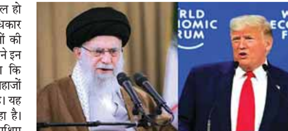
अयातुल्ला अली खामेनेई और अमेरिकी राष्ट्रपति डोनाल्ड ट्रंप

26800 लोग गिरफ्तार मानवाधिकार संगठनों के अब तक कुल 5,002 लोगों की मौत हो गई है। इनमें से 4,716 प्रदर्शनकारी शामिल हैं। इसके अलावा 203 सरकारी पक्ष से जुड़े लोग, 43 बच्चे और 40 ऐसे नागरिक भी मारे गए जो प्रदर्शनों में शामिल नहीं थे। वहीं, ईरानी सरकार ने पहली बार आधिकारिक रूप से मौतों का आंकड़ा जारी किया है। सरकार के अनुसार कुल 3,117 लोगों की मौत हुई है। इनमें 2,427 लोग नागरिक और सुरक्षाकर्मी बताए गए हैं। बाकी मृतकों को सरकार ने 'आतंकी' करार दिया है। मानवाधिकार कार्यकर्ता सरकार के आंकड़ों पर सवाल उठा रहे हैं।